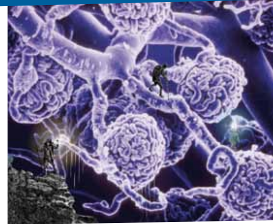
Photomontage de l'exposition « Science/Fiction : voyage au coeur du vivant ». Glomérules. © Celio, Marco / Voyage au centre de la Terre. Jules Verne-Musée Jules Verne-Ville de Nantes. http://www.serimedis.inserm.fr